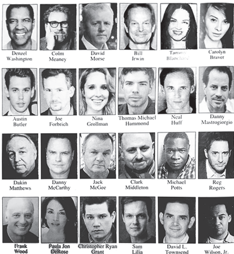
Актерский состав бродвейской постановки «Продавец льда грядет» (2018)

ним, в баре спокойно беседуют жильцы ночлежки. Контраст эмоций переполняет, когда наблюдаешь эту сцену в течение нескольких минут. Страшно, что герой спрыгнет, – и неизвестно, когда он это сделает. Он стоит в левом углу, будто оторванный от общей картины. Такому ощущению помогают потрясающие декорации Санто Локуасто – стена отражает второй этаж, под ней находится задняя комната и часть бара, в середине сцены стоит один квадратный столик с бутылками на нем, а вокруг, по бокам и сзади стоят многочисленные стулья. В какой-то момент Пэррит исчезает. Мы не видим его самоубийства, что усиливает атмосферу страха. Чуть позже раздается глухой звук падения и хруст, по которому становится ясно – герой бросился с пожарной лестницы и разбился насмерть.