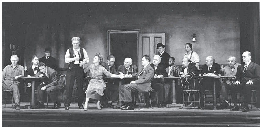
Сцена из первого бродвейского спектакля «Продавец льда грядет» (реж. Эдди Даулинг. 1946)

образ так же достоверно, как и его белокожие коллеги-предшественники – Джеймс Бартон (1946 г.), Джейсон Робардс (1985 г.), Кевин Спейси (1999 г.), Натан Лэйн (2015 г. на сцене Brooklyn Academy of Music – BAM). В экранизациях притчи «Продавец льда грядет» роль Хикки в разные годы исполнили Джейсон Робардс (реж. – Сидни Люмет, США, 1960 г.) и Ли Марвин (реж. – Джон Франкенхаймер, США, 1973 г.). Больше произведение не экранизировали. Зато театральные режиссеры и продюсеры обращаются к нему вновь и вновь. Только на Бродвее пьесу ставили пять раз, считая последний спектакль. Самым успешным на сегодняшний день является первое воплощение на сцене в 1946 году. Мировая премьера притчи состоялась 9 октября 1946 года в “Martin Beck Theatre” (ныне “Al Hirschfeld Theatre”) на 302 W 45 th St. Всего было сыграно 136 спектаклей. Интересно, что сейчас притчу играют на этой же улице, но в другом театре – “Bernard B. Jacobs Theatre” по адресу 242 W 45 th St.